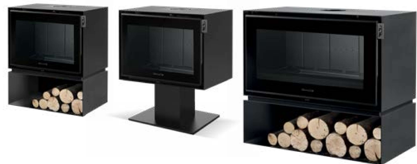
MONTMARTRE 800C FR9011040B EAN: 3760075412036