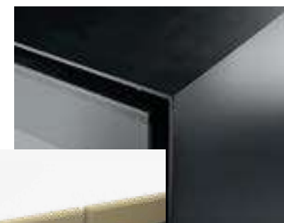
ACABADO DE ACERO GRUESO